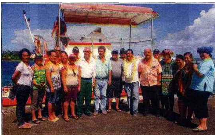
Les maires de Tairapu-Est et Ouest ont souhaité partager leur expérience sur le sujet du rahui .