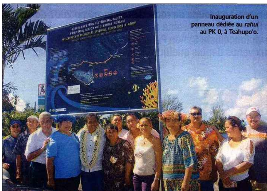
Inauguration d'un panneau dédiée au rahui au PK 0, à Teahupo'o.