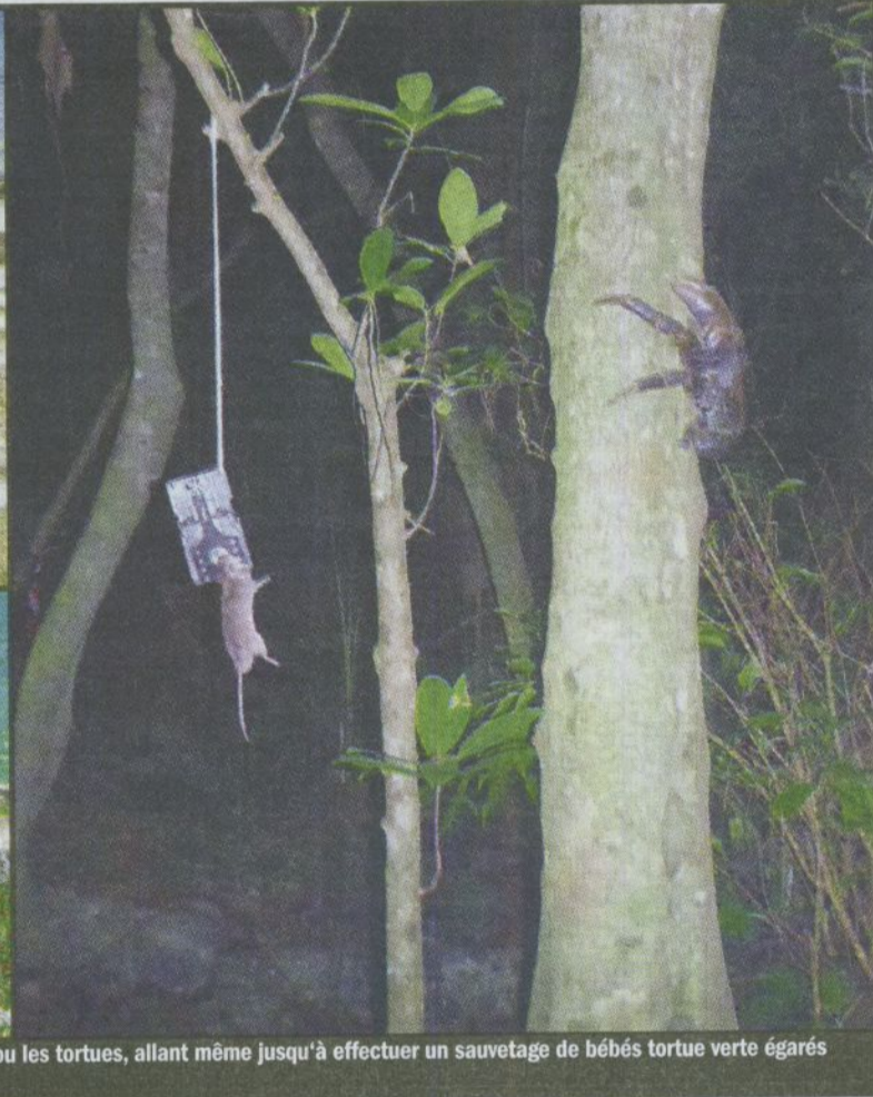
Les bénévoles font tout pour préserver les oiseaux, comme ici ce fou masqué avec ses œufs, ou les tortues, allant même jusqu'à effectuer un sauvetage de bébés tortue verte égarés après l'éclosion. Malheureusement, leurs pièges sont perturbés par les crabes de cocotier.

Le crabe et le rat. Cela pourrait être le titre d'un conte ou d'une fable. A Ouvéa, ce duo est plutôt synonyme de casse-tête. Une morale pourrait même être tirée de leur histoire: « Si le rat de ton îlot tu veux chasser, être plus rapide que le crabe tu dois t'assurer. »