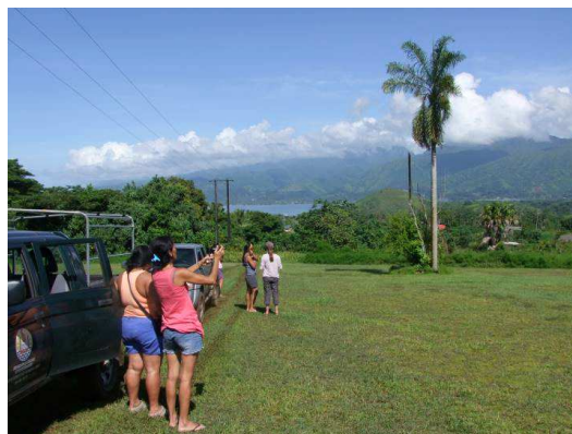
Figure 4: Visite du plateau de Punuhi le mardi 27 janvier