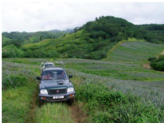
Figure 3: visite du plateau des ananas le lundi 26 janvier