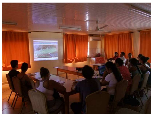
Figure 1: Réunion à la mairie du lundi 26 janvier