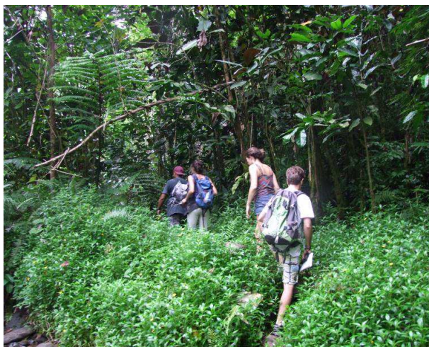
Figure 8: Visite de la zone côtière de Toahotu avec Hinano Leboucher le jeudi 29 janvier