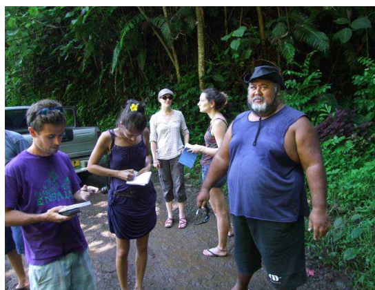
Figure 5: Visite des captages le mardi 27 janvier