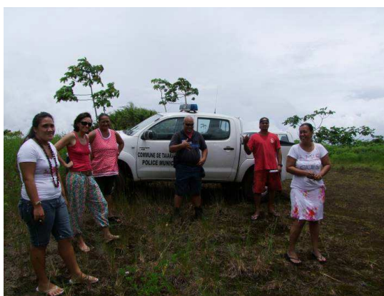
Figure 2: Visite du plateau "Nordoff" le lundi 26 janvier